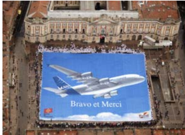
Toulouse und Airbus vereint

Toulouse und Airbus werden in einem Atemzug genannt. Als wir das Airbusunternehmen besichtigten, fanden gerade die Gespräche zur Umstrukturierung statt und hielten die Stadt in Atem. Dort wie bei uns in Bremen und Hamburg geht es um den Erhalt der Arbeitsplätze.